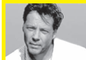
JEAN MOLITOR Fotógrafo (Alemania)

Como escritora, se animó a explorar varios campos. Su primer libro fue de ilustraciones, Vaca Vaca , en 2007. Después publicó el libro de relatos Pequeño ensayo ilustrado , los poemas de Te traje bichos para que juegues y la novela Brasil , publicada en 2011 por su propia editorial. En su última novela, Otaku (Paisanita, 2015), un aficionado a la cultura popular japonesa sueña, a los cuarenta años, con la gran ola tecnológica que lo rescate de la deriva impasible en la que se encuentra.