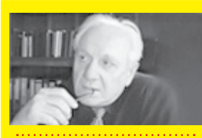
SERGUEI FILATOV Político ruso y Presidente del Fondo de Programas Socioeconómicos e Intelectuales (Rusia)

Fue presidenta de la Cámara Argentina del Libro. Secretaria y Vicepresidenta Ira del GIE.