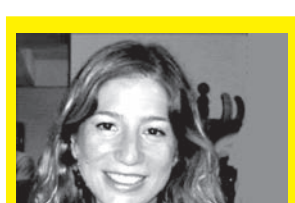
ROMINA FUNES Poeta . (Argentina)

(Montevideo, 1939). Durante el período de la dictadura cívico-militar en Uruguay, Gravina vivió en el extranjero. En esos años residió en Chile, Suecia, Cuba y México. Por su trabajo publicado en 1979, titulado Lázaro vuela rojo se le concedió el premio Casa de las Américas. Sus poemas han aparecido en distintas revistas nacionales e internacionales, especialmente en el suplemento "La República de las Mujeres". En su obra se destaca: Que las cosas fabriquen sus finales (Estuario editora. Montevideo, 2010); La leche de las piedras (Destabanda, 1988); Que diga Quincho (Ed. Nueva Nicaragua. Managua, 1982) y Lázaro vuela rojo (Casa de las Américas. Cuba, 1979)