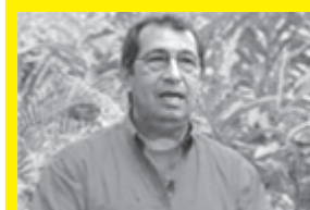
ADÁN CHÁVEZ Docente universitario, físico y político (Venezuela)

Nació en Moscú. En 1964 se graduó en el Instituto Energético de Moscú con un diploma en electromecánica, tras lo cual pasó dos años en Cuba (1966-1968), trabajando como asesor en la planta metalúrgica José Martí. En 1984 obtuvo el título de Candidato a Doctor en Ciencias Técnicas (equivalente a un título de Doctor en Filosofía) y en 1987 recibió el Premio Estatal de la URSS. Es autor de numerosos artículos y publicaciones y ha escrito cuatro libros.