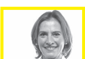
BEATRIZ GUTIÉRREZ MUELLER Escritora e investigadora

(Carolina, Puerto Rico, 1966). Comenzó a publicar poemas desde el 1984 en revistas y periódicos internacionales tales como Casa de las Américas de Cuba, Página doce de Argentina, Revue Noire de Francia y Review: Latin American Literature and Arts, en Nueva York. Premios: Beca Guggenheim en Humanidades, América Latina y el Caribe.