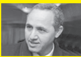
AZZEDINE MIHOUBI Ministro argelino de Cultura

Realizó el Doctorado en la Universidad Complutense de Madrid, España en 1980. Autor de varias obras sobre la crítica literaria, la historia de la literatura, la teoría literaria, la traducción al árabe de la literatura española y latinoamericana y poeta. Fue Presidente de la Unión de Escritores Argelinos, Director del Centro Nacional de los Estudios de la Revolución Argelina 1830- 1962; Director del Laboratorio de la Lingüística y la Literatura Comparada.