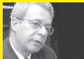
FREI BETTO Teólogo y escritor (Brasil)