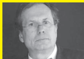
MAURIZIO FERRARIS Filósofo y académico. (Italia)

Carlos Alberto Libanio Christo, Frei Betto. Considerado uno de los máximos exponentes de la Teología de la Liberación. Sacerdote de la orden de los dominicos. Escritor de ideas progresistas que ha apoyado a los movimientos de liberación en América Latina. Es autor de más de cincuenta libros de diversos géneros literarios y de temas religiosos. Posee, entre otros reconocimientos, el Premio Juca Pato por su libro Fidel y la religión , la Medalla de la Solidaridad, de manos del Gobierno de Cuba, el trofeo Paulo Freire de Compromiso Social (2000) de los Consejos de Psicología del Brasil, y el Premio ALBA de las Letras, en reconocimiento al conjunto de su obra literaria.