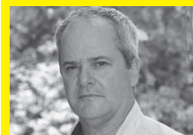
HUGO MITOIRE Escritor (Argentina)

Es uno de los novelistas contemporáneos más aclamados y leídos de Portugal. Su producción literaria aborda los géneros de poesía y novela. Fue profesor durante algunos años en Portugal y Cabo Verde, antes de convertirse en escritor profesional en 2001. Sus libros han sido traducidos actualmente a 26 idiomas. Entre los títulos más significativos de su quehacer literario, figuran En tu vientre , Cementerio de pianos , Galveias , Nadie nos mira . El Premio Nobel de Literatura, José Saramago ha dicho de él: Peixoto es una de las revelaciones más sorprendentes de la literatura portuguesa reciente. No tengo ninguna duda de que es una promesa segura de un gran escritor.