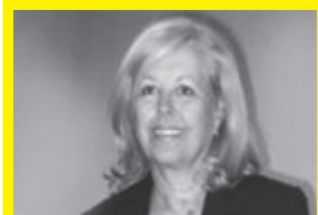
ANA CABANELLAS Editora. (Argentina)

(1959, Aïn Khadra, Argelia). Periodista, poeta, novelista y político. Se desempeña como Ministro argelino de Cultura.