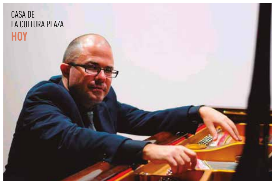
CASA DE LA CULTURA PLAZA HOY

En México, donde reside actualmente, ha participado en el Festival de Jazzatlan y el Eurotur, así como en el Festival Internacional de Jazz de Querétaro. En 2016 fundó su proyecto nuestra visión y grabó su primer CD Visiones y tendencias. Actualmente trabaja en su segundo material discográfico. ●