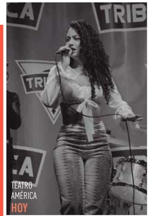
TEATRO AMÉRICA HOY

La ciudad de New York se ha convertido en el escenario de su carrera. ●