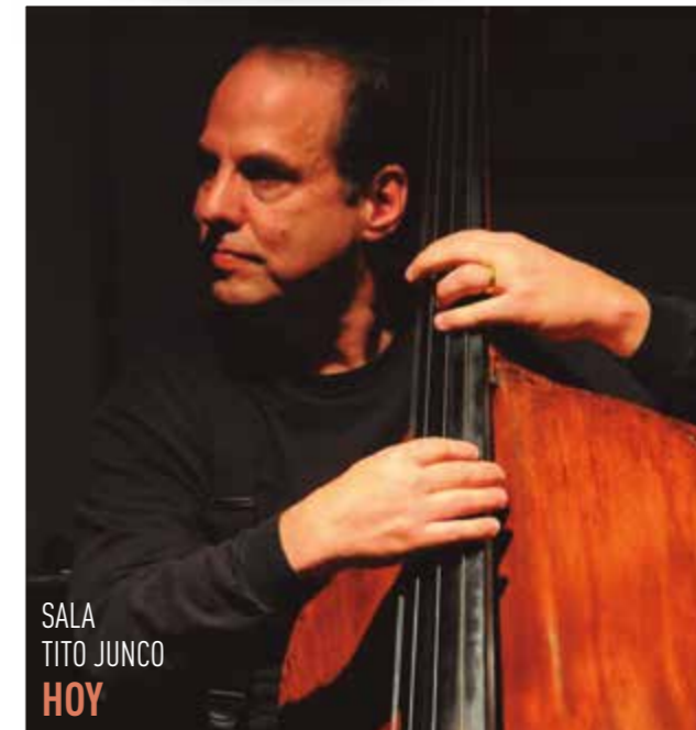
SALA TITO JUNCO HOY

bajado con muchos de los grandes nombres del jazz a lo largo de los años, incluyendo Eddie Daniels, Kenny Davern, Richie Cole, Joe Henderson, Clifford Jordan, Henry Threadgill, Vinnie Golia, Anita O'Day, Sheila Jordan, Mose Allison, Butch Miles (Basie, Brubeck, Ella, etc.), Barney Kessel, Herb Ellis, Roy Hargrove, Jim Pepper y Bill Mays; y los viejos maestros como Gus Johnson, Dulces Edison (Count Basie), Mickey Roker (Dizzy Gillespie, Sonny Rollins, etc.), Stephane Grappelli (Django Reinhart), Carl Fontana (Tonight Show Band), etc. En los años 80 tocó duetos con el inmortal Charlie Haden. ●