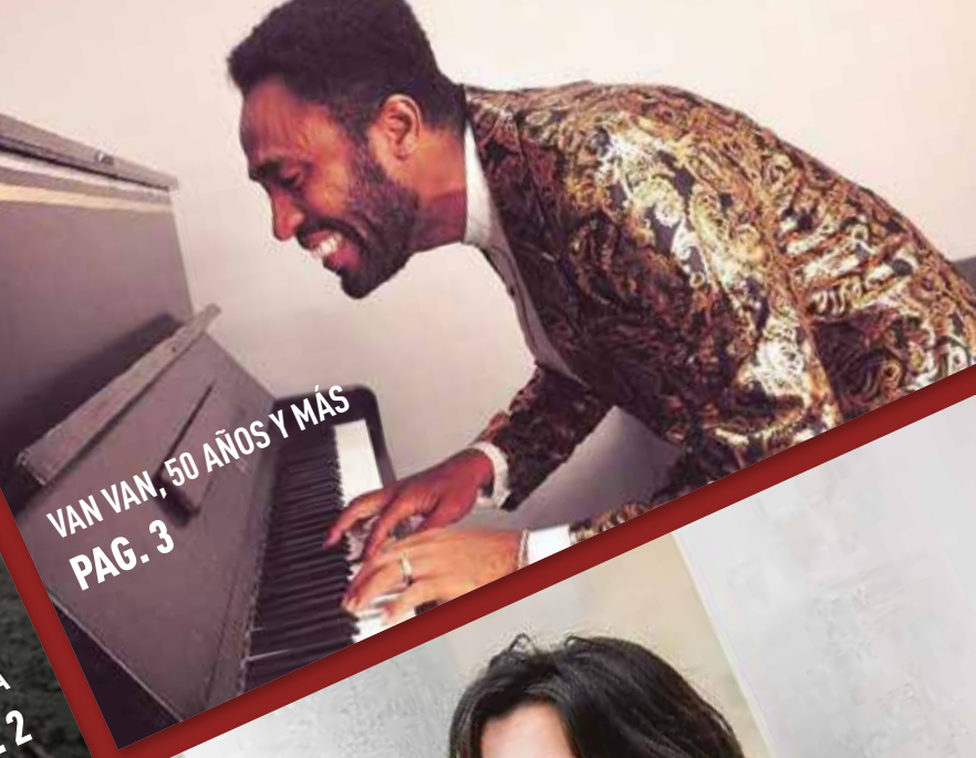
VAN VAN, 50 AÑOS Y MÁS PAG. 3