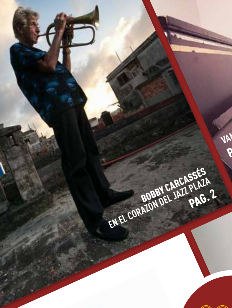
BOBBY CARCASSÉS EN EL CORAZÓN DEL JAZZ PLAZA PAG. 2